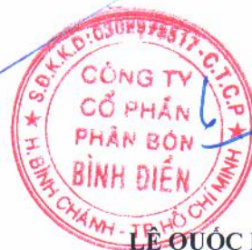
LÊ QUỐC PHONG