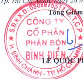
LE QUỐC PHONG