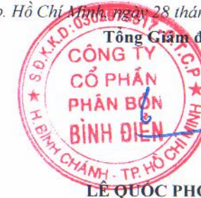
LÊ QUỐC PHONG